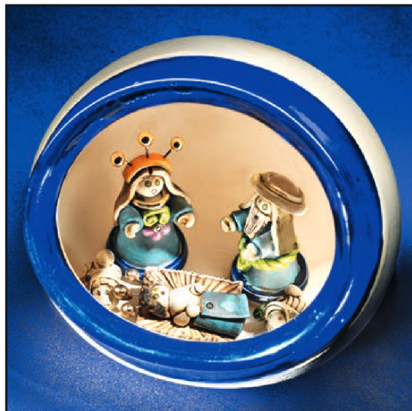
Un pesebre de cerámica del famoso artista colombiano Mauro Phazan.